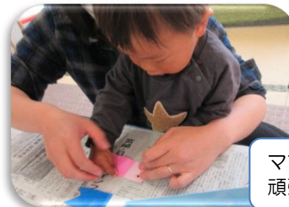
ママと一緒に 頑張ったよ。