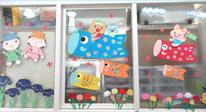
「しゅっぽっぽ」玄関で可愛い鯉のぼりがお出迎え