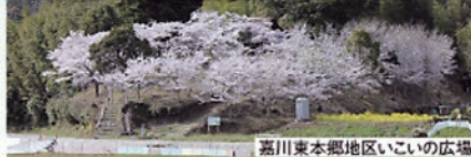
嘉川東本郷地区いごいの広場

調和のとれた地域の発展と住みよい嘉川の創出、並びに文化教養の向上による地域づくりの推進をします。 >>詳しくはこちら