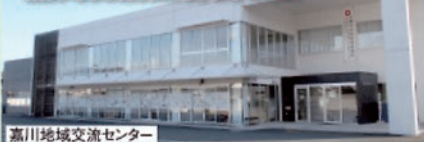
嘉川地域交流センター

住みよい嘉川地域を創造するために、自治会及び各種活動団体と連携し、地域の調和のとれた発展に寄与することを目的としています。 >>詳しくはこちら