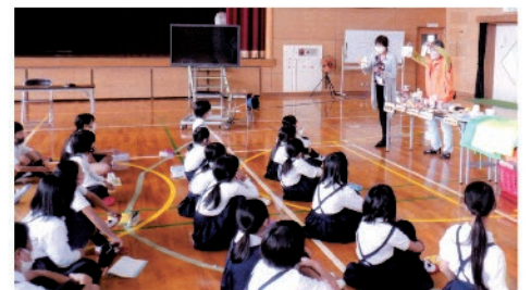
嘉川小学校防災学習

突然やってくる災害に備え、各家庭や各自治会で取り組んでおられると思いますが、何かありましたら、自主防災本部、自治連事務局長までお問い合わせ下さい。地域の安心防災について一緒に考えましょう。