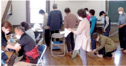
元気アップチャレンジの中の健康測定

嘉川子ども館しゅっぱぽや嘉川・興進小学校の世代間交流への支援をはじめ、自治会で行われる各種サロンや老人クラブ活動、健康相談などの活動に運営費の一部を支援し、健やかな嘉川っ子の育成や健康で長寿、元気で明るく楽しい地域づくりを進めます。