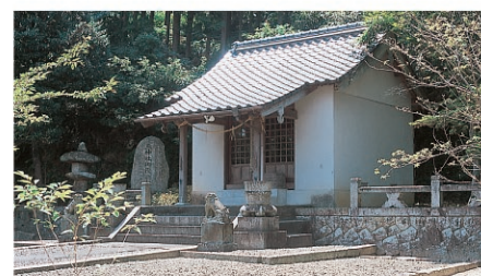
三神社/祭神は市杵島姫命・湍津姫命・心心姫命。境内には多くの石碑や築庭があり春には桜、秋には紅葉が美しい所です。