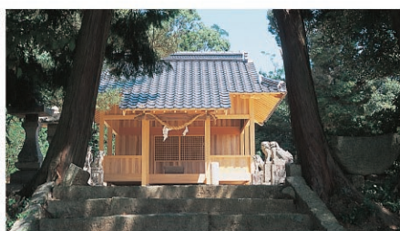
明神社/明治40年、高見の巖島神社に若宮八幡宮(岡)と竜神社(相原)を神社統合し、現在この場所に祀っております。