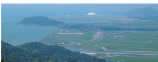
御伊勢山山頂(189.2m)/山頂からは、嘉川・興進地区はもとより周防大橋や阿知須干拓までが一望でき、晴れた日には国東半島も見ることができます。登山口は、山口市南部運動広場と原公会堂横にあり、どちらも約30分で山頂にたどり着きます。