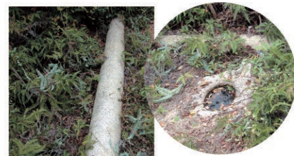
御伊勢山の鳥居/原登山道の山頂近くには解体された鳥居が横たわっています。安永4年(1775)6月と彫っており、江戸時代の「お伊勢参り」ブームに乗って祀られたものと思われる。