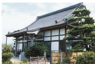
宝松寺/天正年間(1573~92)創建の宝積寺が貞享元年(1684)改宗して曹洞宗となり、明治5年大原長松寺を合併し、宝松寺となりました。