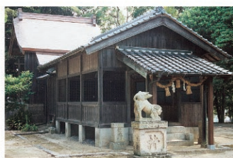
住吉神社/永仁2年(1294)摂津住吉神社より勧請して社殿が建てられ、航海の安全と和歌の神として敬われています。