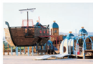
藤尾山/まんじゅう山と呼ばれる藤尾山の山すその海岸では水晶探しが楽しめました。山頂とふもとに藤尾山公園が整備されています。