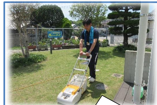
交流センターのおじさん！ 暑い中、芝生の手入れありが とうございます。