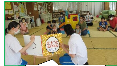
午後は大型絵本の読み 聞かせと体操でしたよ。