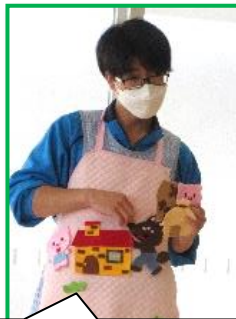
エプロンシアター 「3匹の子ブタ」

第3土曜日はとても賑やかです。 学芸大学実習生のお兄さんお姉さんたちの午前、午後 のお楽しみ会もありました。 パパも育児に参加してとても楽しいひとときでした。