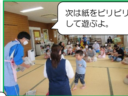
次は紙をビリビリ～！ して遊ぶよ。