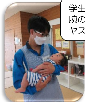
学生さんの 腕の中でス ヤスヤ…。